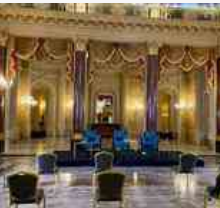
FOTO SLIDE NM - NAPOLI, PANORAMICA SULLA SALA PER LA CONFERENZA DI ADL ALL'HOTEL ST. REGIS A ROMA