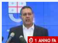
Politica Autostrade, Toti firma esposto in procura e sollecita ministero