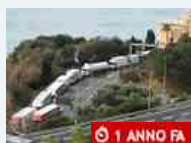
Politica Autostrade, Toti: "Nessuna risposta dal Mit. Qualcuno vuole boicottare la Liguria"