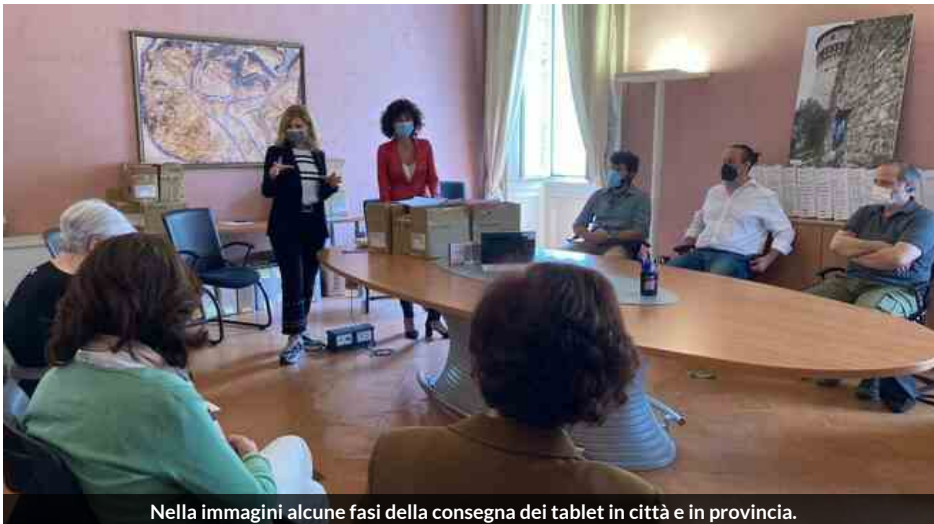
Nella immagini alcune fasi della consegna dei tablet in città e in provincia.