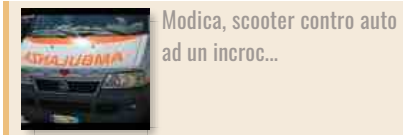
Modica, scooter contro auto ad un incrocio...