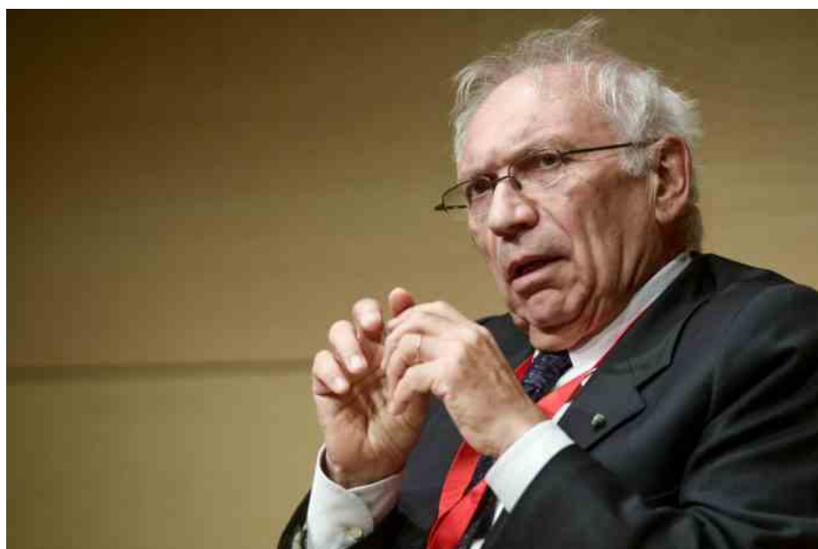
il ministro dell'Istruzione Patrizio Bianchi

Partecipano anche il ministro dell'Istruzione Patrizio Bianchi e il presidente della Regione Emilia Romagna Stefano Bonaccini al ciclo di incontri che il progetto Focus 06: una comunità per il benessere dell'infanzia promuove a partire da lunedì 17