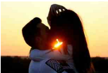
ADOLESCENTI E SESSO 4

La campagna "La maleducazione sentimentale dei giovani" è stata realizzata grazie al contributo della Fondazione Banco di Napoli, . "Abbiamo fortemente sostenuto questo progetto insieme alla Fondazione PRO, convinti della necessità di promuovere tra le giovani generazioni l'educazione ai sentimenti collegata alla sessualità. Come diceva Aldo Masullo, dobbiamo aiutare i ragazzi ad imparare il lessico delle emozioni – ha dichiarato la Presidente, Rossella Paliotto -. Soprattutto tra coloro che subiscono le insidie della strada e sono privi di riferimenti morali".