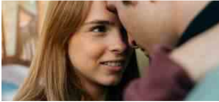
ADOLESCENTI E SESSO 2