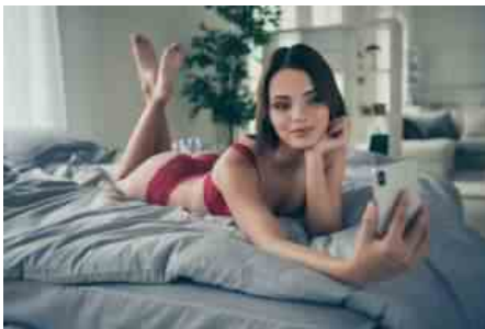
ADOLESCENTI E SESSO 3

“Partiamo dai primi dati epidemiologici raccolti nell'ambito del progetto 'La maleducazione sentimentale dei giovani' per capire come invertire la rotta, parlando con i ragazzi e fornendo loro gli strumenti necessari per vivere una vita sana e piena”, ha affermato Vincenzo Mirone, Ordinario di Urologia dell'Università Federico II di Napoli e Presidente di Fondazione PRO. Il progetto prevede il coinvolgimento degli studenti in incontri formativi e gruppi di lavoro interni alla scuola; la creazione di un Teen Channel, una piattaforma liberamente consultabile sulle tematiche sentimentali e sessuali; la realizzazione di uno spot e la possibilità di fare visite con urologi, nutrizionisti, medici dello sport, psicologi e sessuologi a bordo della Unità Mobile.