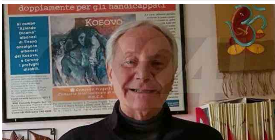
Don Giacomo Panizza

Il 21 marzo non segna solo l'inizio della primavera, ma è anche il giorno della memoria : quella delle vittime innocenti di mafia. In questa Giornata il progetto Ip Ip - Infanzia Prima, selezionato da Con i Bambini (Fondo contro la povertà educativa ), vuole tenere alto l'impegno che le organizzazioni partner portano avanti sul territorio. Donne, giovani, madri, fratelli e sorelle, a volte bambini che sono caduti da sud a nord del Paese sotto i colpi di una guerra tra bande e clan nel nome dei traffici illeciti e del controllo del territorio.