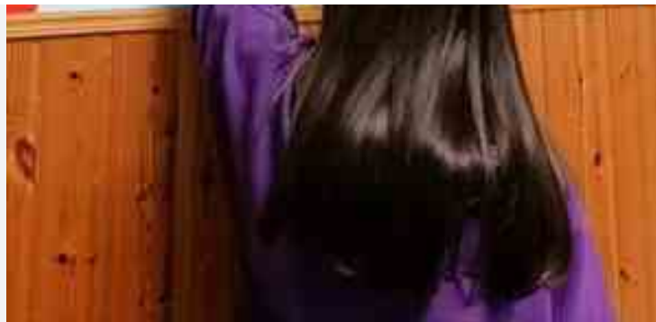
"Futuro d'Autore"

È in pieno svolgimento tra Bari, Bitonto, Giovinazzo e Molfetta , il progetto "FARE - Futuro d'autore" che mira a rendere i ragazzi "liberi e autori della propria vita, capaci di costruire per sé un futuro diverso da quello che le loro storie sembrerebbero aver già tracciato per loro" .