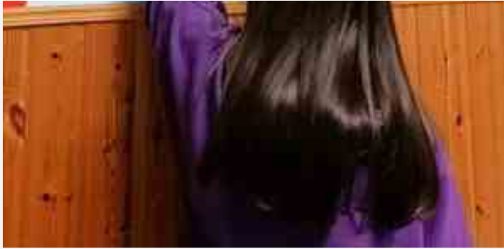
"Futuro d'Autore"

È in pieno svolgimento tra Bari, Bitonto, Giovinazzo e Molfetta , il progetto "FARE - Futuro d'autore" che mira a rendere i ragazzi "liberi e autori della propria vita, capaci di costruire per sé un futuro diverso da quello che le loro storie sembrerebbero aver già tracciato per loro" .