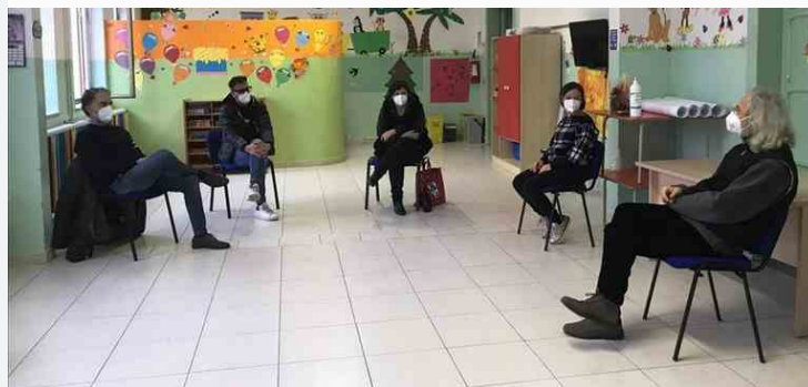
Kairos: il Cse di San Martino in Pensilis pronto ad “acciuffare” le opportunità

PIÙ INFORMAZIONI SU San Martino in Pensilis Termoli