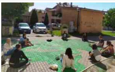
Volontari a Fonti San Lorenzo

corsi online e la consegna a domicilio di libri della biblioteca popolare, nonché la terza annualità del partenariato strategico nel Programma Corpo Europeo di Solidarietà (tra le 14 organizzazioni beneficiarie a livello nazionale).