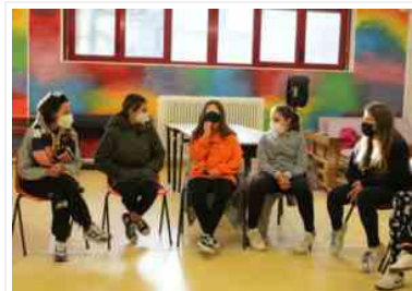
"Sotterfugio" - Fonti San Lorenzo