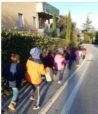
Ludoteca a Fonti San Lorenzo a Recanati

Quattro anni dopo, nel 2016, il Centro inizia a fare progettazione europea . Riceve l'accreditamento al Servizio Volontario Europeo (Erasmus+) iniziando ad ospitare annualmente nei propri spazi due volontari provenienti da tutta l'Europa, ampliando gli orari di apertura e l'offerta proposta. Inizia inoltre la progettazione di scambi europei che coinvolgeranno, ogni scambio, oltre trenta ragazzi provenienti da diversi paesi europei.