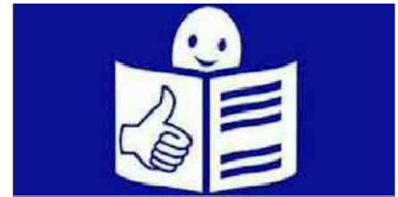
Il linguaggio facile da leggere