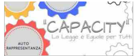
Progetto "Capacity: La Legge è Eguale per tutti"

https://percorsiconibambini.it/inclusi/2021/02/15/inclusi-dalla-scuola-alla-vita-andata-e-ritorno/