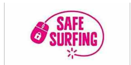
Safesurfing - sicurezza online per le persone con disabilità intellettiva