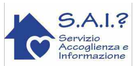
Hai bisogno di informazioni? Chiedi al nostro sportello S.A.I.!