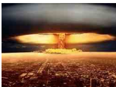
Lettere al direttore