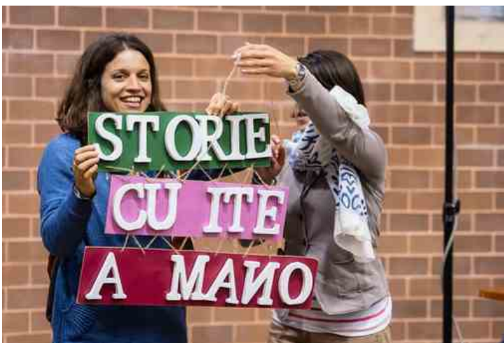
oggi si festeggia (online) il secondo compleanno dell'iniziativa Storie Cucite a Mano