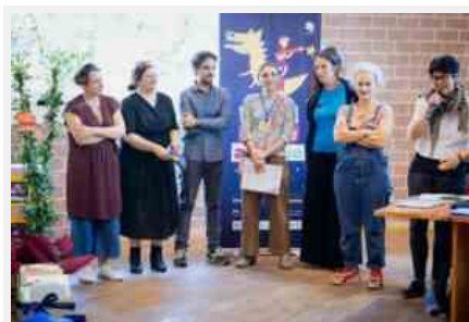
I partner di Storie cucite a mano

Venerdì 8 gennaio alle 18 infine si festeggeranno i due anni di Storie cucite a mano con una festa di compleanno virtuale con tutti i partner, gli educatori, le associazioni e le famiglie coinvolti.