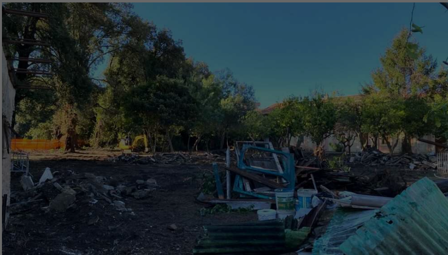
📷 L'area era ricoperta da rifiuti e materiale di vario genere

Restituire il patrimonio della Reggia di Caserta alla collettività, i Liparoti liberati da anni di incuria e degrado. La direzione dell'istituto museale ha avviato e portato a termine una serie di iniziative finalizzate a curare, mantenere e salvaguardare gli spazi del Complesso vanvitelliano, in molti casi dimenticati o maltenuti da decenni. Il "quartiere" Liparoti venne costruito all'interno del bosco vecchio a partire dal 1769 per accogliere i marinai di Lipari adibiti, per la loro esperienza, alla cura della flottiglia che stazionava nella Peschiera Grande realizzata poco distante. Una parte di esso, fino al 2016, è stata occupata da ex custodi della Reggia di Caserta che risiedevano al suo interno.