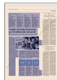
Peso: 1-3%, 11-52%

Le istituzioni non profit in Lombardia sono 55mila, 16% del settore a livello nazionale. Con poco meno di 200mila lavoratori, coinvolgono 1,1 milioni di volontari e producono un valore di 17,5 miliardi di euro pari all'incirca al 4,5% del Pil lombardo. Gli enti che avranno bilanci in perdita passeranno da circa un terzo (media triennio 2017-2019) a circa i tre quarti nel 2020, a causa di cali di ricavi e aumento dei costi