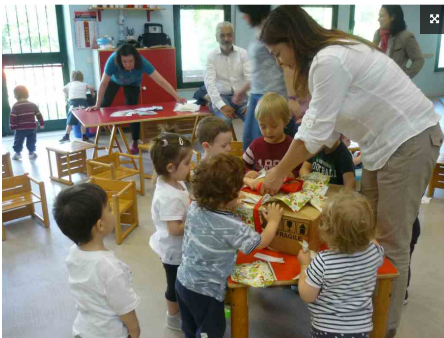
I bambini di un asilo

PERUGIA – Punta l'attenzione su piccoli e piccolissimi, per offrire loro un'opportunità fondamentale per lo sviluppo cognitivo e relazionale dei bambini nei primi anni di vita, specialmente per i minori che provengono da contesti di disagio economico e sociale. Si chiama "Comincio da zero" il nuovo bando di Con i Bambini promosso nell'ambito