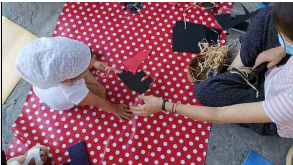
Laboratori per bambini

Firenze, 5 novembre 2020 - Libri e visite al museo "sospesi", giochi, incontri e laboratori diventano occasioni di crescita personale e sociale, di educazione e di relazione. E' il progetto nazionale "Ip Ip Urrà, Metodi e Strategie Informali per Mettere l'Infanzia Prima", selezionato dall'impresa sociale "Con i Bambini" nell'ambito del Fondo per il Contrasto della povertà educativa minorile, che vede protagonista anche Firenze grazie alla Coop L'Abbaino, del consorzio Co&So, e al Consorzio Mestieri Toscana. "Ip Ip Urrà