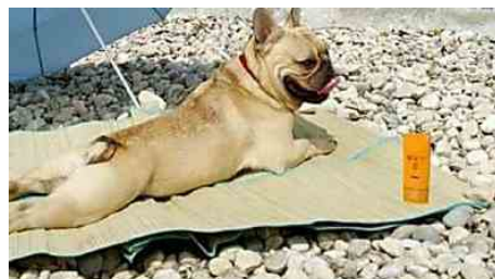
Foto spassosissime in spiaggia che