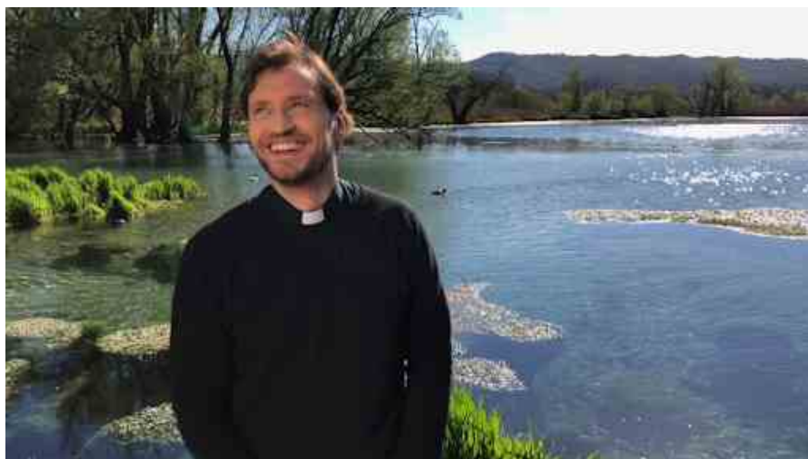
Don Davide Banzato, conduttore dei “Viaggi del cuore” su Rete 4

Su Rete 4, e anche all'estero nel canale internazionale Mediaset Italia, nuova edizione del programma condotto da don Davide Banzato