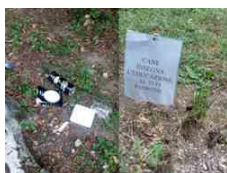
Lettere al direttore