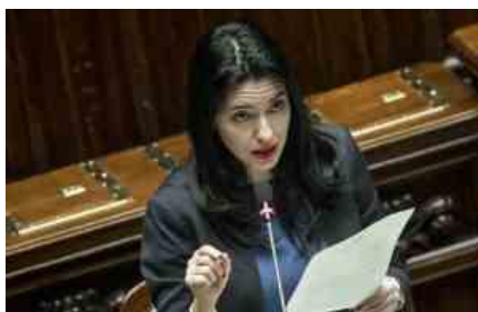
La ministra dell'Istruzione Lucia Azzolina (M5S)

Oltre la metà delle scuole italiane sono vecchie: hanno più di 45 anni. Una percentuale minore, ma non residua, ha oltre un secolo di vita. A ricordarlo è un report dell'"Osservatorio Povertà educativa minorile #conibambini" che, insieme ad Openpolis, sta realizzando un focus sullo stato dell'edilizia scolastica in vista del rientro degli studenti nelle scuole a settembre poiché le regole di distanziamento fisico imposte dall'emergenza Coronavirus obbligano ad un diverso utilizzo degli spazi dove svolgere lezione.