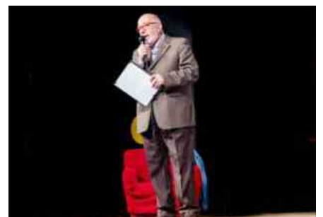
9a Rassegna Teatrale 'Premio Città di Monte Compatri, 1a serata