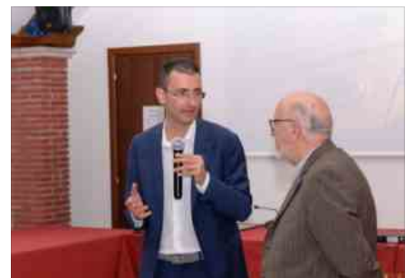
Presentazione del docu-film "40 anni in... Controluce"