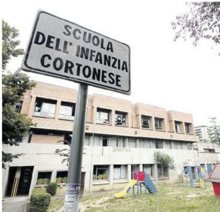
PERUGIA Il giardino di una scuola dell'infanzia. Il dato umbro del verde per studente è inferiore alla media nazionale

PER IL RAPPORTO OPENPOLIS SONO MENO DI 8 METRI QUADRATI A STUDENTE UNDER 17 PERUGIA VA UN PO' MEGLIO DI TERNI