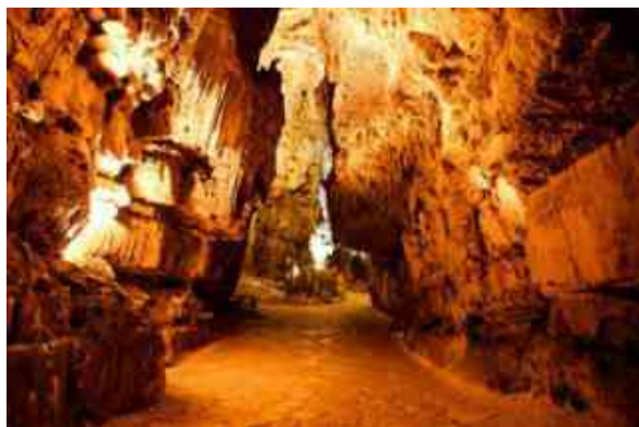
Grotte di Castellana

Aperture straordinarie alle Grotte di Castellana (Ba) in occasione del Carnevale 2020. Da sabato 22 a martedì 25 febbraio, il complesso carsico pugliese amplia notevolmente il ventaglio delle visite guidate , così da offrire più occasioni ai visitatori di scoprire uno tra i principali attrattori turistici pugliesi.