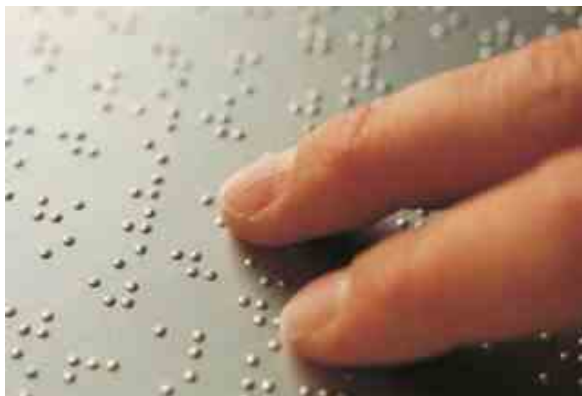
Corso lettura e scrittura Braille

In occasione della Giornata Nazionale del Braille , momento di sensibilizzazione dell'opinione pubblica nei confronti delle persone non vedenti, Parcocittà e la Cooperativa Sociale Louis Braille promuovono "Letture in punta di dita". È un laboratorio gratuito di lettura e scrittura Braille per le bambine e i bambini dai 6 ai 10 anni (ma anche per i loro