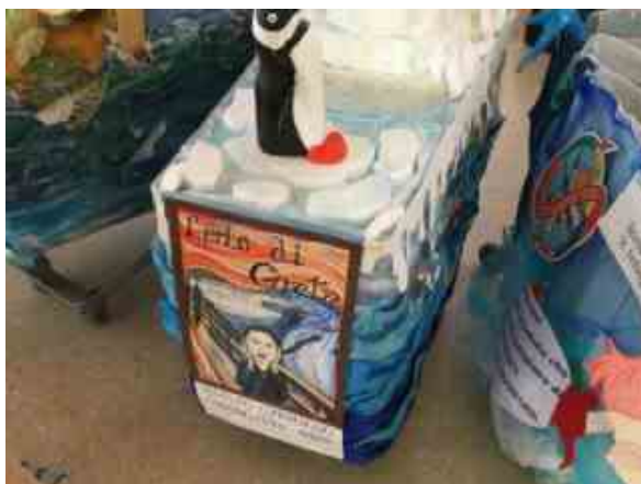
Eco carrelli allegorici

I bambini sfileranno nei corridoi della galleria con i carrelli eco-allegorici da loro realizzati che rimarranno in mostra in piazza Ottagono, nel cuore del Gran Shopping.