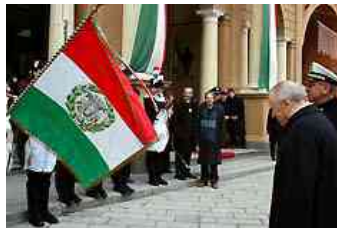
Reggio Emilia 2004: il tricolore a piazza Prampolini

6/1/2020 – Le celebrazioni per il 223° anniversario del Primo Tricolore, nato a Reggio Emilia il 7 gennaio 1797, si apriranno, domani martedì 7 alle 10, con l'alzabandiera delle bandiere italiana ed europea in piazza Prampolini, gli onori militari e l'esecuzione dell'inno nazionale. L'alzabandiera sarà preceduta dal suono a distesa della Campana civica. Piazza Prampolini sarà sorvolata da tre velivoli Evektor Eurostar EV97 della scuola di volo Top Gun Fly di Reggio Emilia che, passando in formazione con fumogeni colorati, comporranno il tricolore sul cielo della città. Ospite d'onore della giornata il presidente del Parlamento europeo David Sassoli , esponente del Pd (e poteva essere altrimenti?).