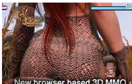
New browser based 3D MMO