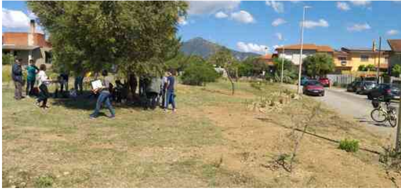
Il giardino possibile di Musei in piazza Paganini

Un po' come già successo a Musei, dove ora fa bella mostra di sé una piazza Paganini rimessa a nuovo con tante piantumazioni e spazi decorosi prima preda del degrado. O a Villamassargia dove la grande area da 5mila metri quadrati che ospitava il vecchio cimitero è stata trasformata e ha già potuto ospitare diverse attività. Ora quella stessa area, proprio grazie ad una delle tante attività dei più piccoli, ha preso il nome di "Sa Sedda Froria".