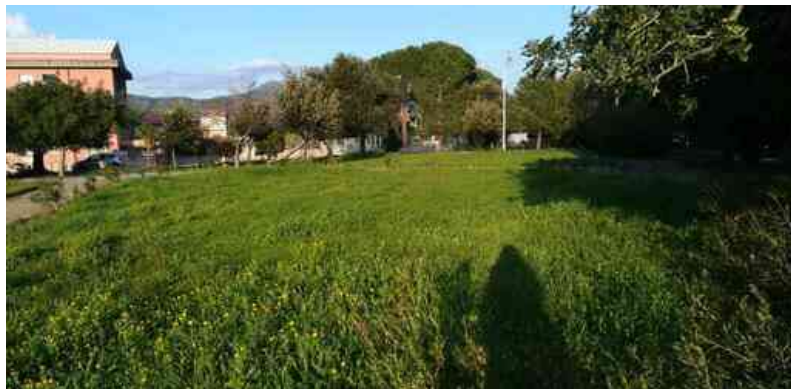
Ampi e bisognosi d'intervento gli spazi dell'area ubicata di fronte al centro Aias