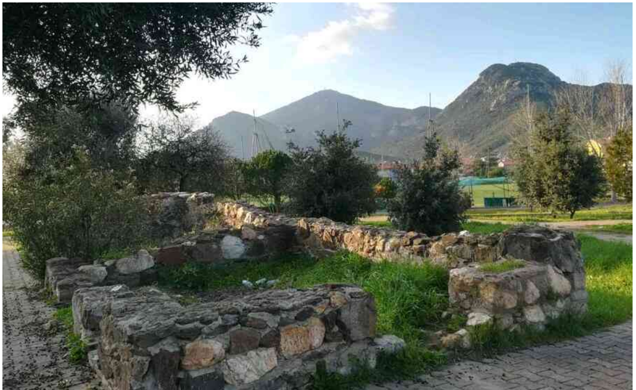
L'area di via Bonn a Domusnovas

È ora la volta di Domusnovas dopo le due aree periferiche di Musei e Villamassargia già sottratte al degrado e divenute contenitori per tante attività con protagonisti bambini e associazioni culturali: parte domani il progetto che mira a ridisegnare la vasta area periferica di via Bonn (fronte centro Aias nella zona 167 del paese) e renderla finalmente sfruttabile per varie iniziative.