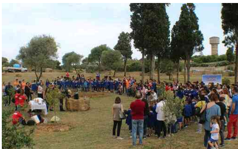
Il giardino possibile di Villamassargia, ora divenuto sa Sedda Froria