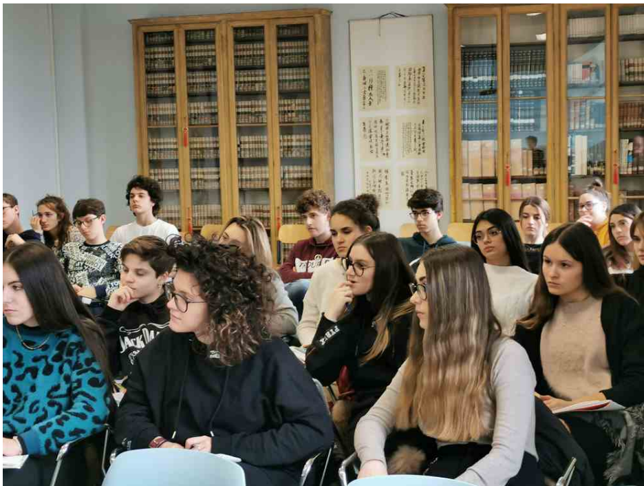
Alcuni degli studenti e delle studentesse partecipanti al nuovo percorso

Nell'aula Confucio del liceo "G. Leopardi", ha preso il via il percorso di potenziamento-orientamento in discipline giuridico-economiche; si tratta di una nuova curvatura aperta, da ieri pomeriggio, agli studenti e alle studentesse del terzo anno, fino al quinto, di classico e