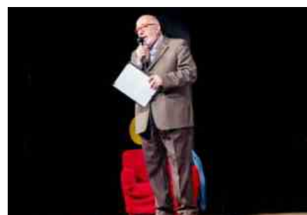
9a Rassegna Teatrale 'Premio Città di Monte Compatri, 1a serata