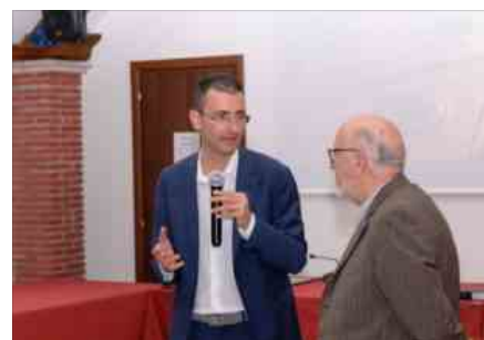
Presentazione del docu-film "40 anni in... Controluce"