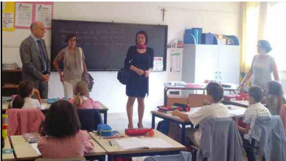
La giunta a scuola