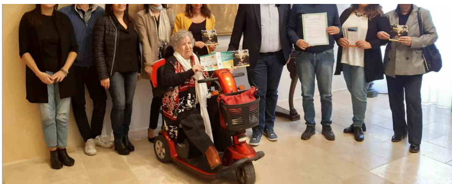
“Non uno di meno” torna per il secondo anno

Al via la seconda annualità di “ Non uno di meno “, progetto finanziato dall’impresa sociale “Con i bambini” che ha coinvolto, nell’anno scolastico 2018/2019, oltre 1.400 studenti e 150 docenti, oltre a quasi 50 famiglie che hanno usufruito di un supporto mirato.