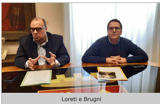
Loreti e Brugni

Al via la seconda annualità di “ Non uno di meno “, progetto finanziato dall’impresa sociale “Con i bambini” che ha coinvolto, nell’anno scolastico 2018/2019, oltre 1.400 studenti e 150 docenti, oltre a quasi 50 famiglie che hanno usufruito di un supporto mirato.