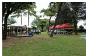
Nidi in festa a villa Cozza