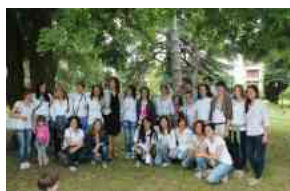
"Nidi in festa" a Villa Cozza