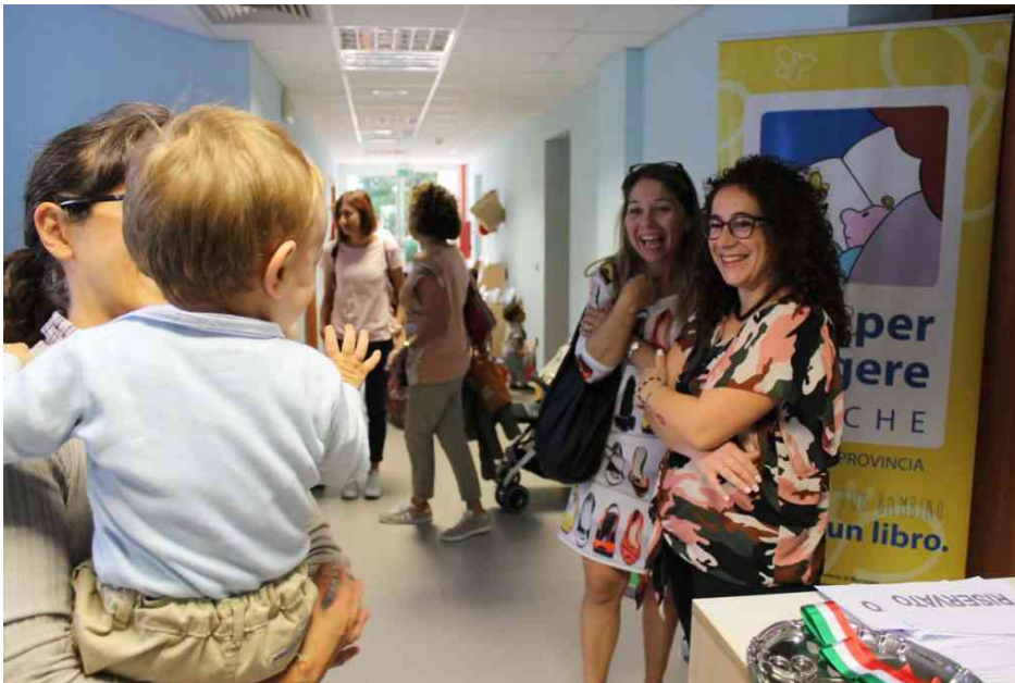
Il punto Nati per leggere