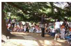
A Villa Cozza c'è Nidi in festa