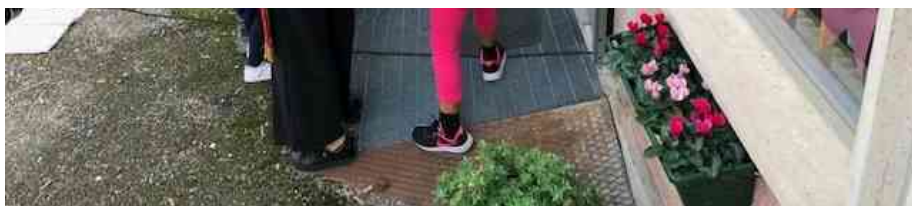
Nuova sede Centro per le Famiglie di Fabriano

FABRIANO – Supporto educativo e scuola, tornano le attività di Resiliamoci per famiglie e minori a Fabriano . Attivo lo sportello pedagogico e già in programma incontri per i genitori della scuola media sui temi dell'apprendimento, oltre a iniziative con gli studenti. Sono tante le occasioni gratuite di sostegno al Centro per le Famiglie di via Petrarca.