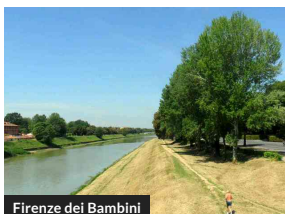
Firenze dei Bambini

5 eventi per bambini a Firenze nel weekend (6 – 8 settembre)