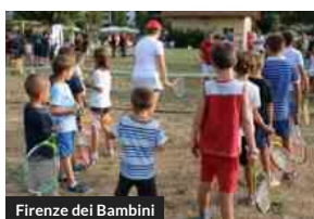
Firenze dei Bambini

Festa dello sport a Firenze, le date quartiere per quartiere