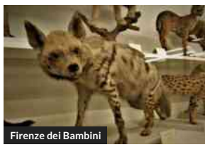
Firenze dei Bambini

La scuola delle piante, bambini alla scoperta del verde di Firenze