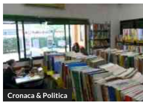
Cronaca &amp; Politica

La Specola chiude per restauro. Ma prima, una visita per grandi e bambini