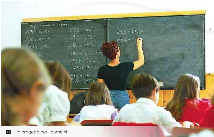
Un progetto per i bambini