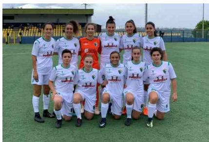
CHIETI CALCIO FEMMINILE SUPERA 2-1 LE FREE GIRLS...