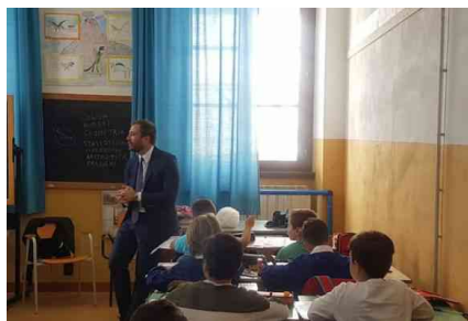
GIULIANOVA, RIAPERTURA SCUOLE: IL SINDACO FA VISITA AGLI...