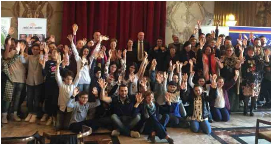
Con Panthakù, gli studenti salernitani in cerca dei loro talenti

I dati oggi disponibili sono allarmanti: nel 2018 la Campania è ancora la prima regione per indice di povertà educativa . Il 77,9 per cento dei minori nella fascia 6-17 anni non ha assistito ad uno spettacolo teatrale, il 69,3 per cento non ha visitato un museo o una mostra e il 69,1 per cento non ha letto un libro, nell'anno precedente alla rilevazione. In questo contesto nasce "Panthakù. Educare dappertutto", selezionato dall'Impresa Sociale Con i Bambini nell'ambito del fondo per il contrasto della povertà educativa minorile. Capofila è Ai.Bi. Associazione amici dei bambini e 24 sono le realtà pubbliche e private partner di un progetto selezionato insieme ad altri 85 tra gli oltre