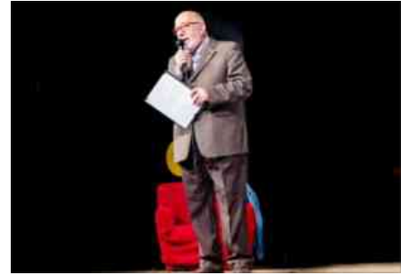
9a Rassegna Teatrale 'Premio Città di Monte Compatri, 1a serata