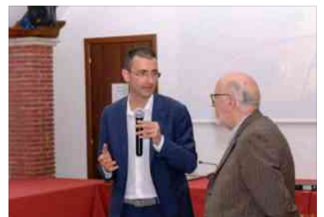
Presentazione del docu-film "40 anni in... Controluce"