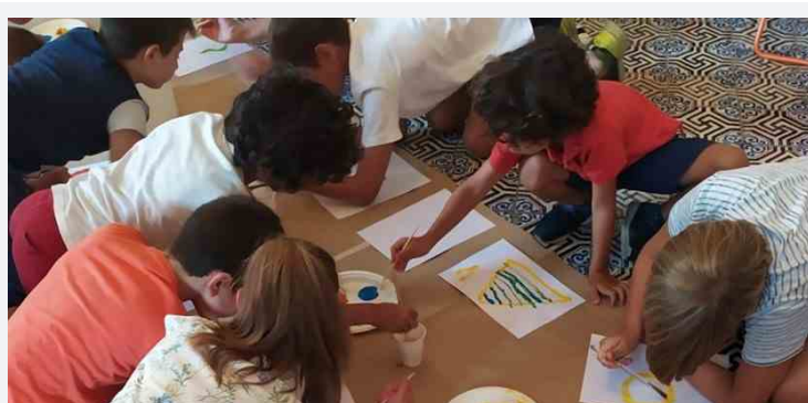
Attività di 'Welcome Lab'

ATTUALITÀ Bitonto venerdì 26 luglio 2019 di La Redazione