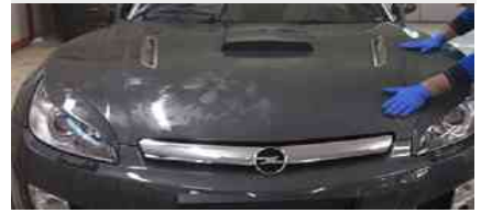
BANNER2 - Mifracar

'Stiamo lavorando affinché si crei, una solida comunità educativa che lavori per contrastare la povertà educativa che attanaglia il nostro territorio - afferma ancora Marco Di Sabato- . Per questo, vogliamo promuovere e sviluppare in modo significativo, competenze personali, relazionali e cognitive dei ragazzi, sia all'interno dei loro percorsi formativi sia in quelli di inclusione sociale, attraverso azioni congiunte "dentro e fuori la scuola", sviluppando e rafforzando l'alleanza, le competenze, il lavoro e la capacità di innovazione