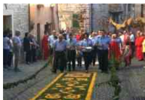
Domenica a Gualdo Tadino l'infiorata del Corpus Domini