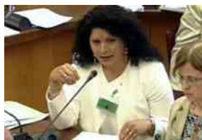
Comunanza, eletto il nuovo Consiglio di Amministrazione