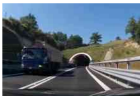
Perugia-Ancona chiusa per lavori tra Casacastalda e Valfabbrica