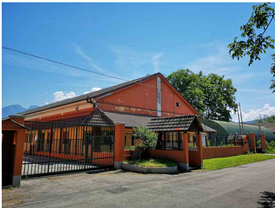
Capofila Tib Teatro. L'iniziativa è stata finanziata dall'impresa sociale, attiva a livello nazionale, "Con i Bambini".