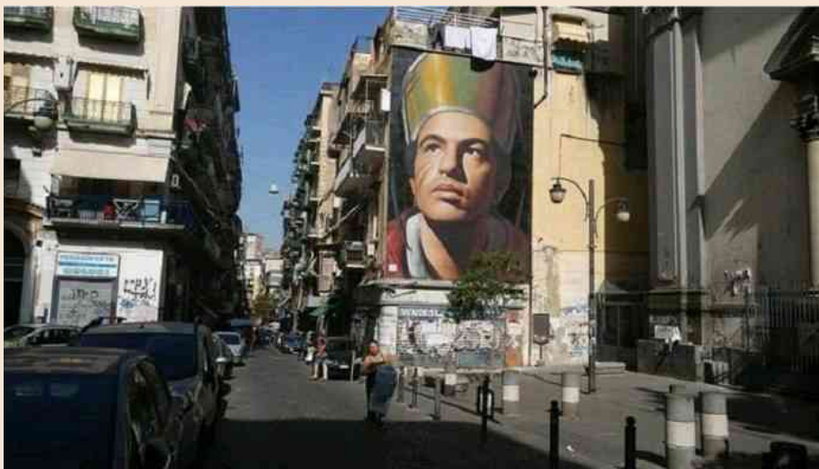
In foto il quartiere di Forcella a Napoli