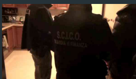
Camorra nel Veneziano, il video degli arresti