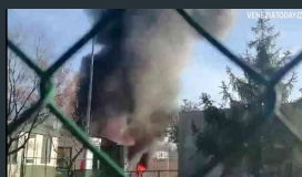
Due container in fiamme al campo sportivo di Martellago | VIDEO