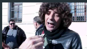
«Basta sgomberi, ci stanno deportando»: la protesta di Rom e Sinti in Regione | VIDEO