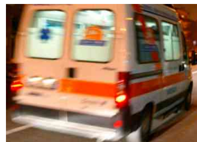
Immagine di repertorio