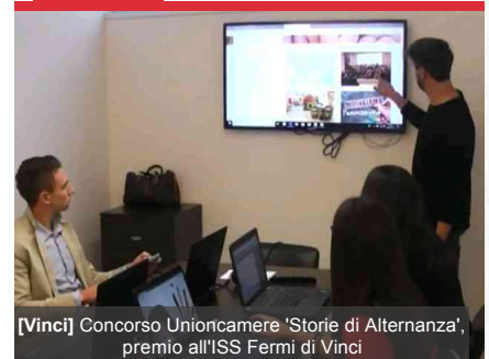
[Vinci] Concorso Unioncamere 'Storie di Alternanza', premio all'ISS Fermi di Vinci