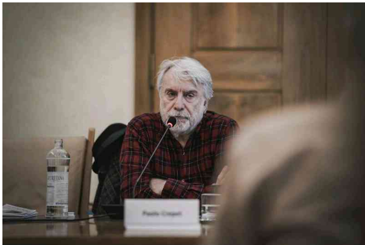
Paolo Crepet

"E' necessario riscoprire la fermezza educativa, cioè la capacità di prendere e mantenere decisioni educative nell'interesse dei ragazzi, anche quando per l'adulto sono emotivamente costose". Le parole dello psicoterapeuta Paolo Crepet sono una possibile risposta alle sfide imposte oggi da tecnologie e innovazioni che stanno cambiando anche il mondo dell'insegnamento, tema centrale della seconda 'Biennale della Scuola' che si è svolta oggi a Firenze, presso la Fondazione Biblioteche (via Bufalini 6). 'Magnetica', il convegno-dibattito sulla scuola che non disperde, organizzato dalla Fondazione CR Firenze in collaborazione con l'Ufficio Scolastico Regionale per la Toscana, ha chiamato a raccolta istituzioni, studiosi e operatori del settore per condividere e confrontare le buone pratiche, i