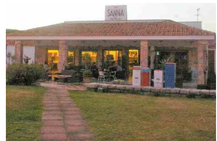
AGLIENTU, RENA MAJORE: "BAR SANNA" SI VA A...TUTTA BIRRA