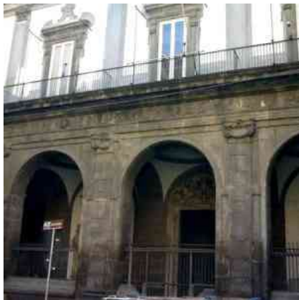
Il Pio Monte della Misericordia

La Casa delle arti e dei mestieri di Pio Monte della Misericordia, in via Tribunali, ospiterà martedì 15 maggio il convegno "Costruire la comunità educante a partire da una sperimentazione su spazi e metodi". Con l'incontro prende il via Arteteca Ludoteche museali, un progetto selezionato dall'impresa sociale Con i bambini nell'ambito del Fondo per il contrasto della povertà educativa minori.